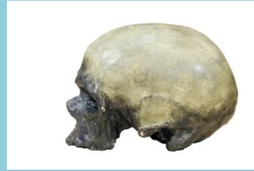
Homo sapiens Le front bombé montre la présence de cortex préfrontal