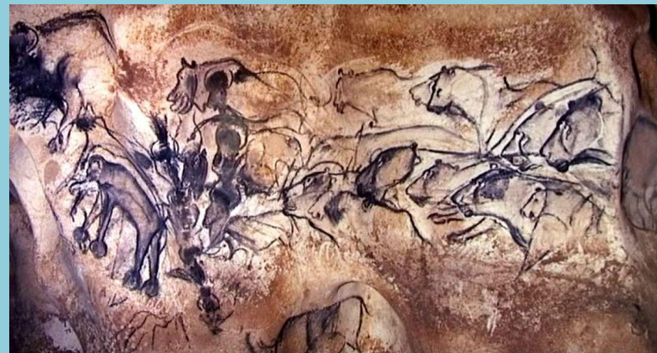
Panneau des lions à la grotte Chauvet

Plusieurs types d'arts pariétaux existent : la sculpture ou le modelage à base d'argile, la gravure , le dessin (emploi d'une seule couleur) et la peinture (emploi de plusieurs couleurs). Dans ces différents types d'arts, on peut retrouver des tracés digitaux où l'on peut voir la largeur des doigts, ou des animaux.