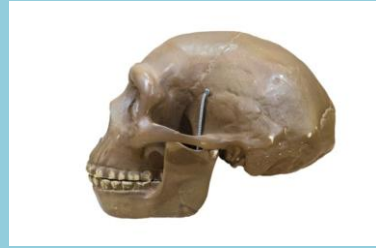
Homo erectus (type Homme de Tautavel) 400.000 ans Le front fuyant montre l'absence de cortex préfrontal

L'art pariétal dit l'art des cavernes est très ancien. Il serait apparu en Afrique il y a environ 77 000 ans et en Europe il y a 34 000 ans. L'art n'était pas présent plus tôt car la partie du cerveau qu'on appelle le cortex préfrontal, située à l'avant du crâne, ne s'était pas encore développée. Elle permet de pouvoir créer, imaginer ou communiquer.